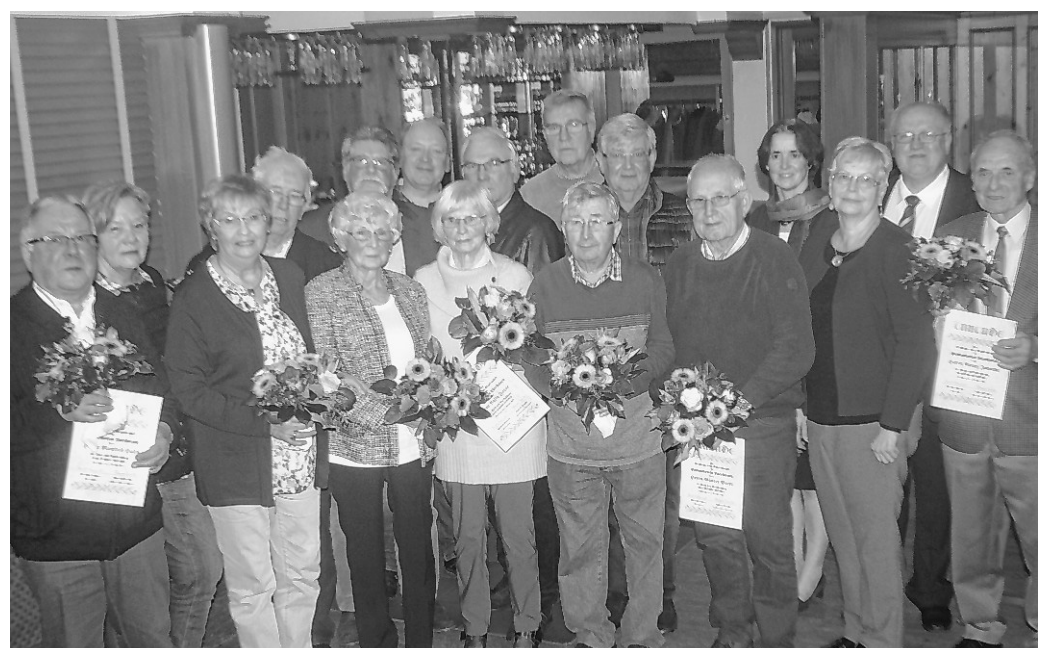
Urkunden und Blumen für die Geehrten: Der Heimatverein Lüerdissen zeichnet bei der Jahreshauptversammlung zahlreiche langjährige Mitglieder aus.

Lemgo-Hörstmar. Die „Lustigen Wanderer“ treffen sich am morgigen Mittwoch am Sportplatz Hörstmar zur nächsten Tour ab Brüntorf. Pkw-Abfahrt ist um 13 Uhr. Die Tour führt dann über den Stränger Weg zum Hollenstein, wo eingekehrt wird.